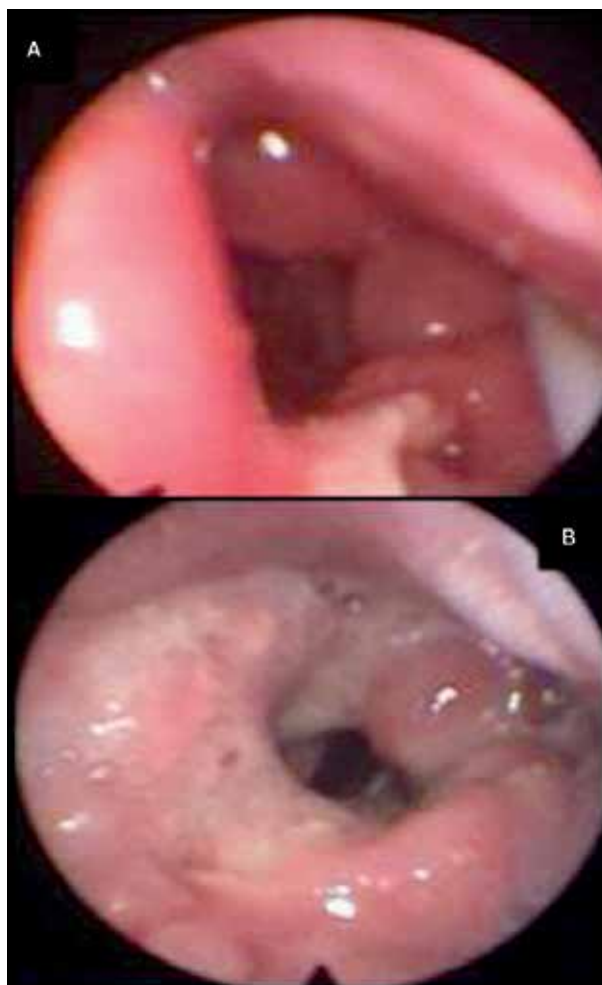
Figuras: A) Caso 1. Lesión granulomatosa vegetante que obstruye la glotis, compromete repliegue aritenopiglótico izquierdo con lago salival. B) Caso 3. Lesión granulomatosa purulenta supraglótica.

Paciente femenina de 46 años, tabaquista. Consultó por disfonía de 4 meses de evolución asociada a expectoración mucopurulenta, pérdida de peso y diaforesis nocturna. Palpación del cuello negativa. Mediante RFLC se observaron lesiones granuloma-